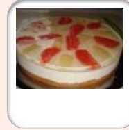
Champangerjogurthtorte mit Grape...